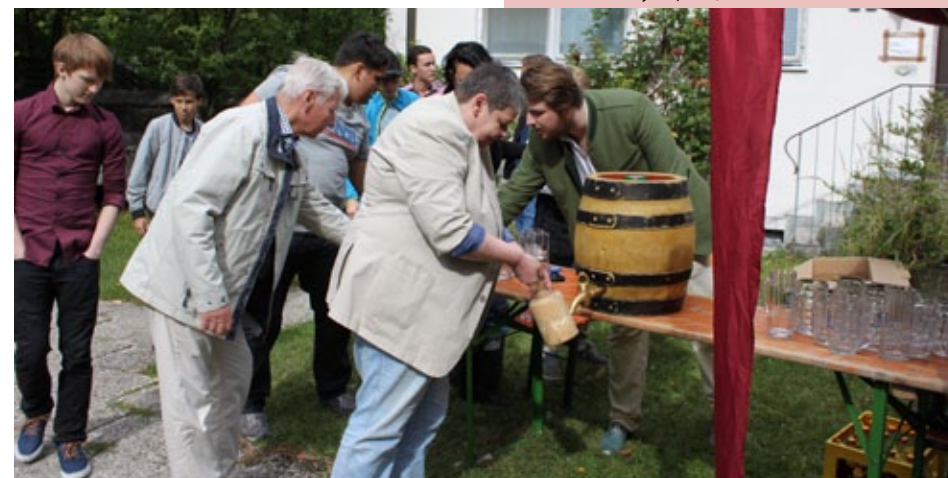
Heiki-Sommerfest, 15. Juli 2017

Am Montag, 11. Dezember 2017, 8. und 22. Januar, sowie 5. und 19. Februar 2018 jeweils ab 19:30 Uhr in St. Alto.