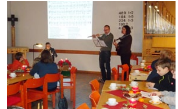
Ökumenisches Adventssingen, Dezember 2016