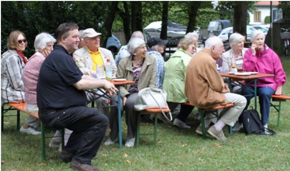
Heiki-Sommerfest, 15. Juli 2017

Die Themen werden noch bekannt gegeben. Bitte achten Sie dafür auf die Flyer und den Aushang.