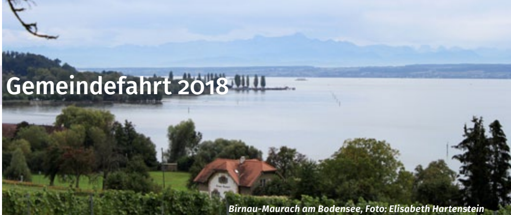
Birnau-Maurach am Bodensee