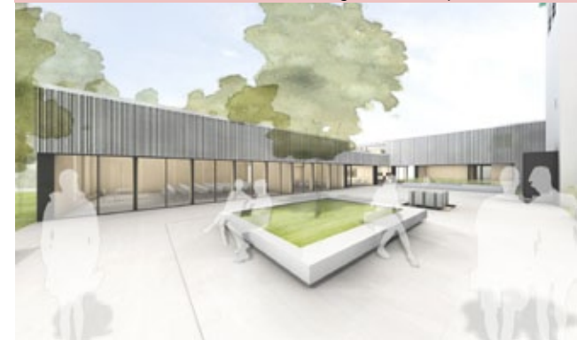
Neubau Gemeindezentrum: Visualisierung des Innenhofes