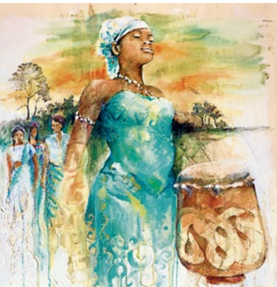
Titelbild zum Weltgebetstag 2018