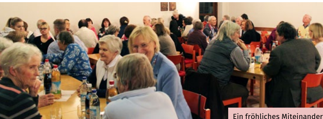
Ein fröhliches Miteinander