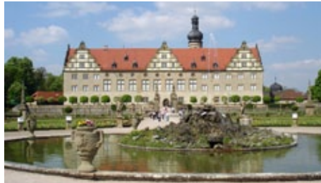
Romantische Straße, Schloss und Park Weikersheim

München in Richtung Augsburg, Nördlingen, Dinkelsbühl, Rothenburg ob der Tauber und den Tillmann Riemenschneideraltären in der Nähe, nach Bamberg oder Würzburg oder beides, wenn möglich. Das Übernachtungsquartier muss noch überlegt werden.