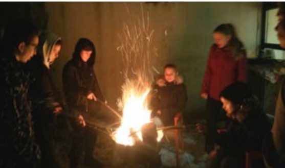
Winterliches Lagerfeuer mit Stockbrot

Das Leiterteam möchte den Jugendlichen auch nach ihrer Konfirmation eine altersgemäße Bindung an die