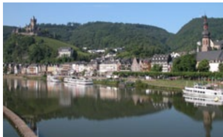
Blick auf Cochem

Da diese Ziele weiter entfernt sind, sollten wir in diesem Jahr davon Abstand nehmen und abwarten, wie die weitere Entwicklung in der Firma Weinberger läuft.