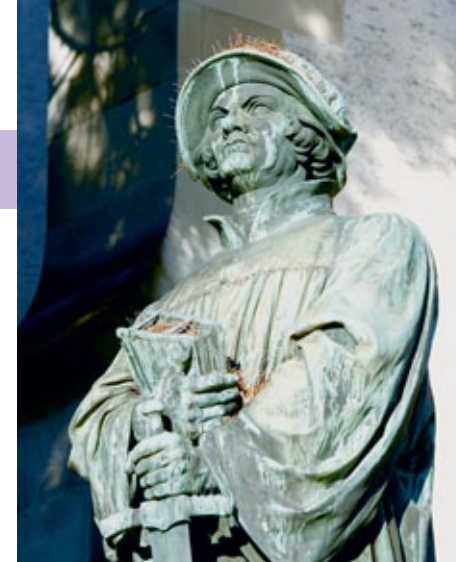
Ulrich Zwingli, Wasserkirche in Zürich

In diesen Jahren veränderte sich der bis dahin kirchentreue Priester Zwingli grundlegend – aus ihm wurde mehr und mehr ein scharfer Kritiker der katholischen Kirche. Er predigte und legte das