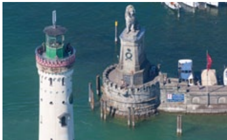
Lindau Hafeneinfahrt, Quelle: Stadt Lindau, Pressebilder, Foto: Archim Mende

Friedrichshafen mit Zeppelinwerk, evtl. Standortquartier, Meersburg mit den Pfahlbauten in Unteruhldingen, Konstanz, die Inseln im See Mainau und Reichenau, je nach Zeit St. Gallen am Heimfahrtstag