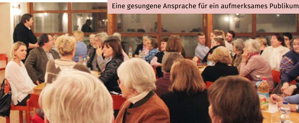
Eine gesungene Ansprache für ein aufmerksames Publikum