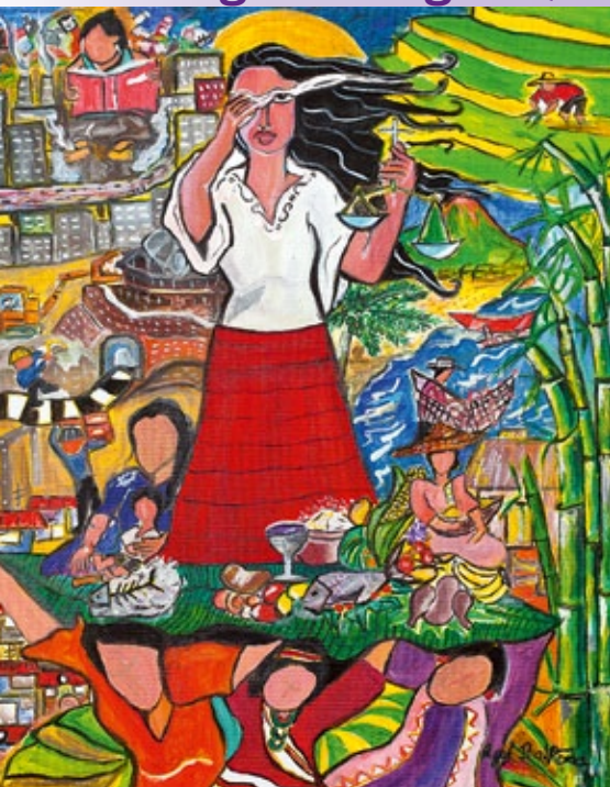
Titelbild zum Weltgebetstag 2017