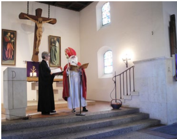
Familiengottesdienst, 6. Dezember 2015

für die ganze Familie 2. Advent, 4. Dezember 2016 um 10 Uhr und Heiligabend, 24. Dezember 2016 um 14:30 Uhr in der Heilandskirche