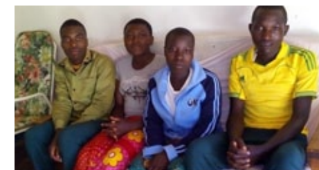
Azubis aus Mavande – gefördert von der Jesajagemeinde. Nach den wohlverdienten Sommerferien sind die 4 Jugendlichen (zwei Mädchen, zwei Jungen) wieder in der Schule am Lernen.

Sollten Sie sich angesprochen fühlen, melden Sie sich doch einfach im Pfarramt oder beim Partnerschaftsausschuss.